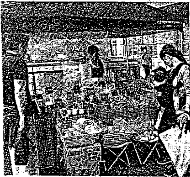
プリローダは5月、東急ハンズ江坂店前で無農薬野菜の路面販売を始めた